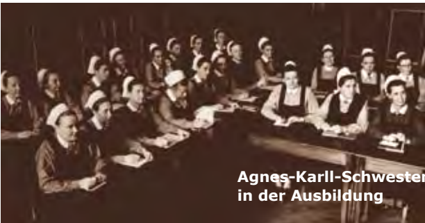
Agnes-Karll-Schwwestern in der Ausbildung

Für Agnes Karll stand die Qualität der Aus- und Weiterbildung ganz oben auf der Liste der Maßnahmen, die Ziele der Berufsorganisation zu erreichen. So setzte sie sich für eine staatlich geregelte Ausbildung ein, wie sie erstmals 1907 vom damaligen Königreich Preußen per Gesetz verbindlich umgesetzt wurde. Zu der Zeit blickte Agnes Karll schon nach Amerika auf die dort an den Hochschulen verankerte Pflegeausbildung.